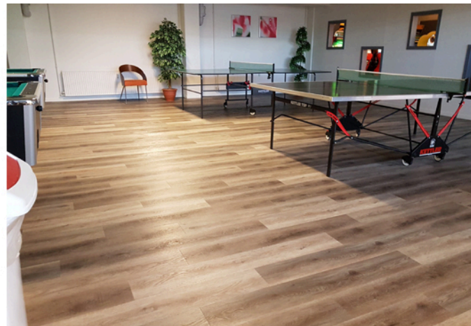
Aktivetsrummet. Efter vandskade i aktivetsrummet, er der malet og lagt "støjdæmpende" gulv.