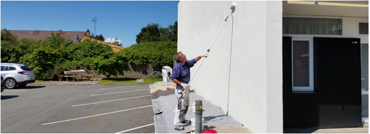
Malereparationer over hele centret.