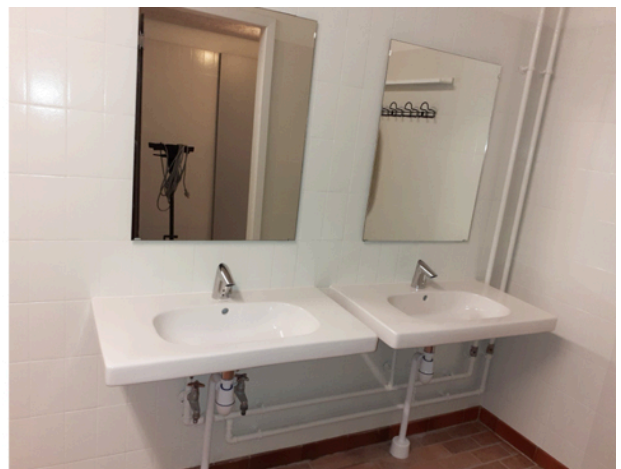
Opgraderede vaske og toiletter flere steder.