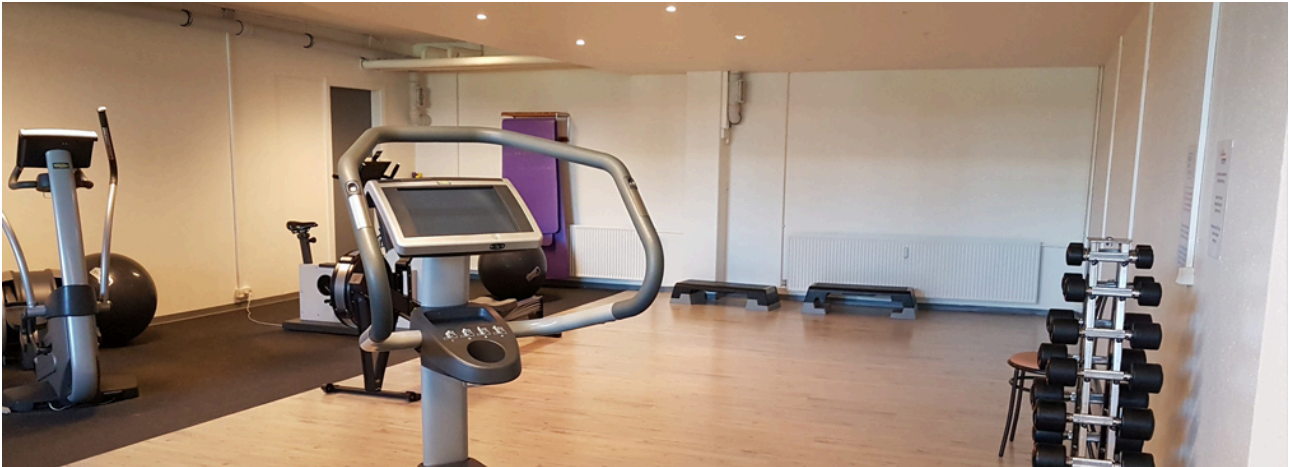
Fitnessrummet. Nyt look, hvor gamle kabiner og defekt massagestol er fjernet